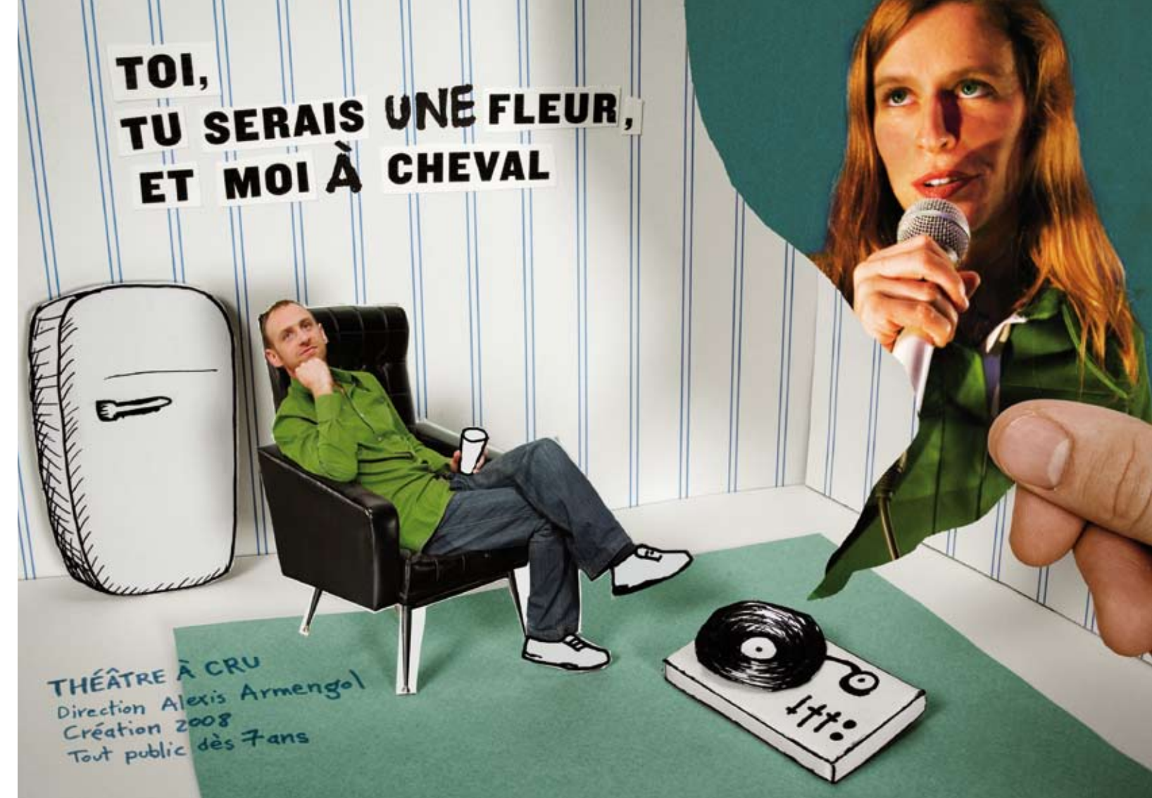
Graphisme Hugo Bouquard / www.hugobouquard.com - décembre 2007